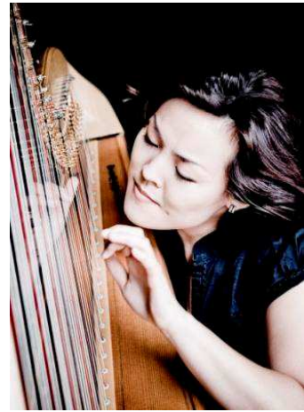
Lavinia Meijer