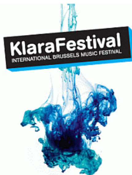
Logo KlaraFestival 2010

2. Gent: ( www.festivalgent.be ) Gent is eerder een stadsfestival met o.a. het evenement 'OdeGand' en eigen producties. Daarnaast zijn er concerten door orkesten en bekende namen. De afdeling Gent organiseert onder de noemer Festival+ ook een groot aantal concerten op locatie in de provincie Oost-Vlaanderen in de maanden september/oktober. Optredende ensembles zijn vooral Vlaams.