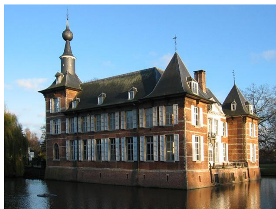
Kasteel van Schoten