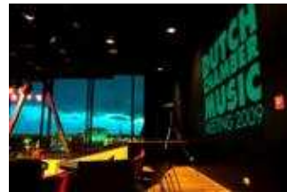
Opening in het Bimhuis

Programma en film vind je op www.mcn.nl/dcmm