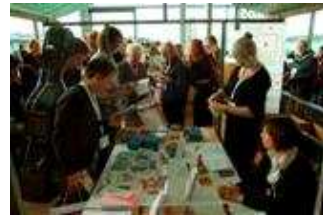
Op de markt van de Dag van de Kamermuziek

Wil je terugkijken? Het programma, de film en deelnemerslijst staan op www.mcn.nl/dvdk09