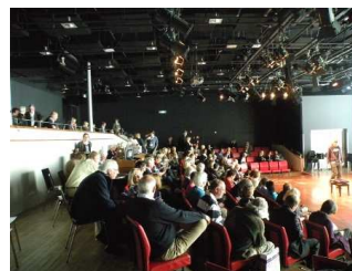
Publiek in Bimhuis tijdens het Presentatiepodium 2009

Inschrijven kan tot en met 17 mei via het inschrijfformulier. Voor meer informatie, voorwaarden en inschrijven zie www.mcn.nl/dvdkm10/presentatiepodium .