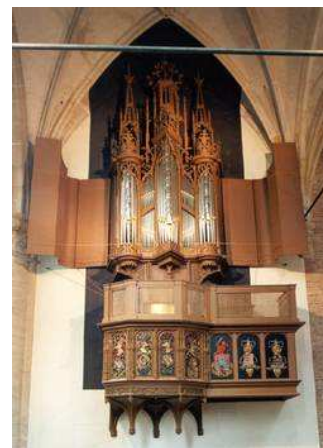
Van Covelens-orgel, Alkmaar