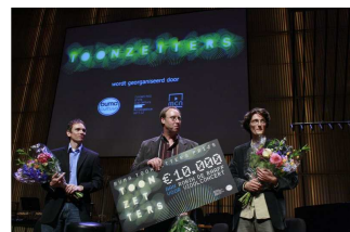
Prijsuitreiking Toonzetters 2009